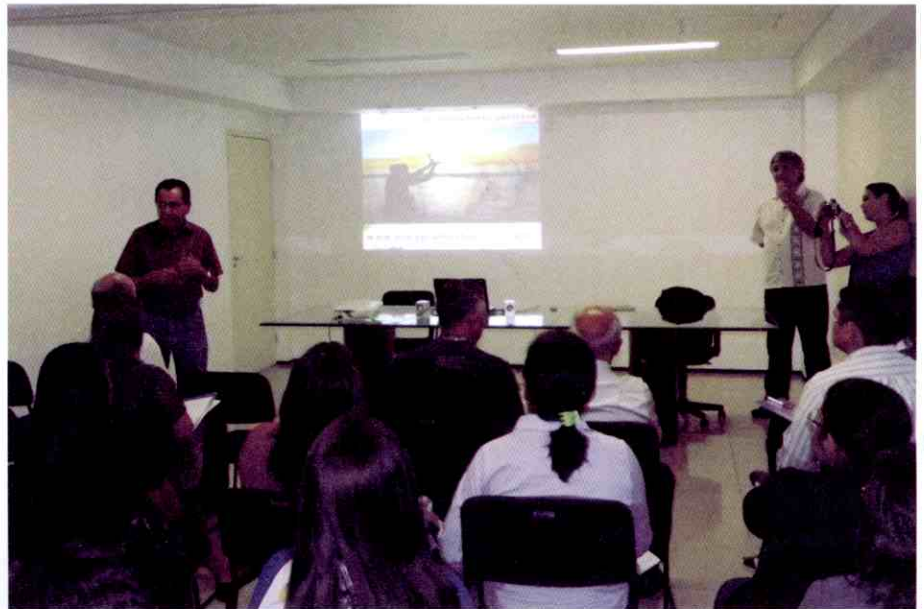
Colaboradores da CDL/SPC conhecem o “Eneagrama”

O ministrante apresentou os nove tipos de pessoas: o tipo 1 são pessoas idealistas, muito organizadas, disciplinadas, responsáveis, trabalhadoras; o segundo tipo são pessoas que vieram ao mundo para ajudar, vivem em função das necessidades das outras; o tipo 3 são pessoas dinâmicas e empreendedoras, naturalmente fazem sucesso; o quarto tipo são pessoas com grande sensibilidade, criatividade,