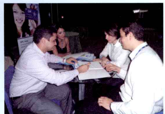
Equipe do SPC apresentou produtos no Piauí Vendas

A Câmara de Dirigentes Lojistas de Teresina contou com um estande para exposição de seus serviços, distribuição de material explicativo sobre os produtos disponibilizados pelo SPC, além de disponibilizar uma equipe para o cadastramento de novos associados.