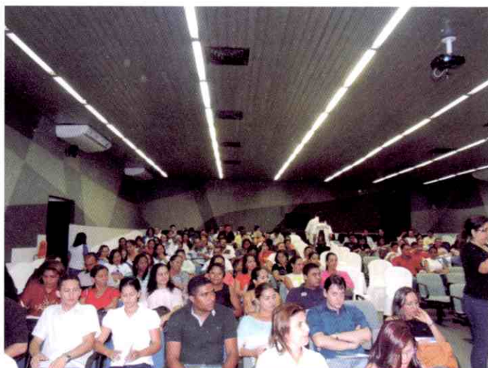
Lojistas e comerciantes marcaram presença no Seminário Estadual