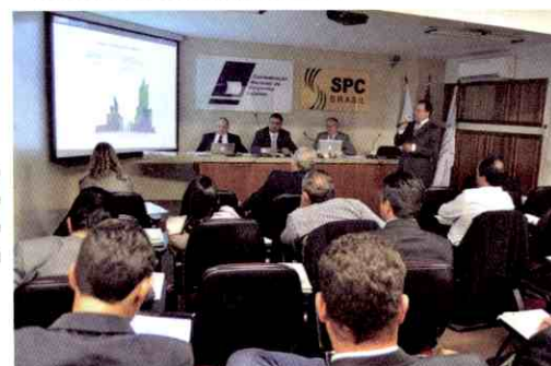
Conselho Nacional de SPCs se reúne em Brasília